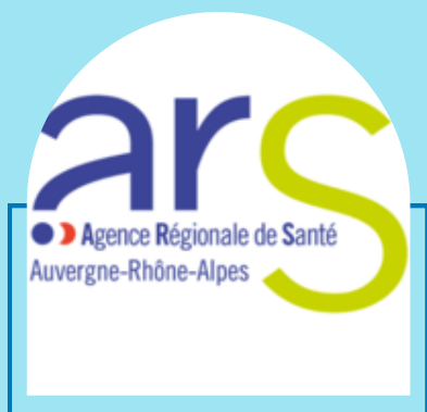
Agence Régionale de Santé Auvergne Rhône-Alpes