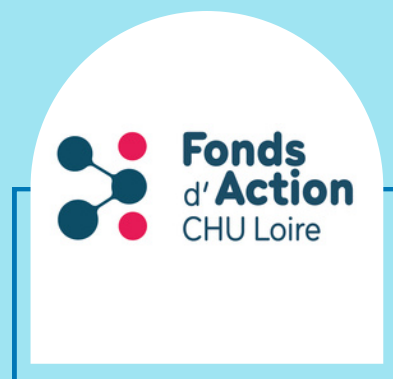
Fonds d'Action CHU Loire