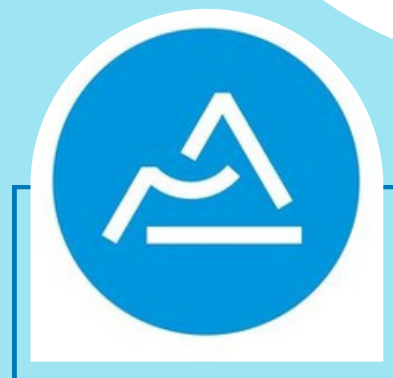
Région Auvergne Rhône-Alpes