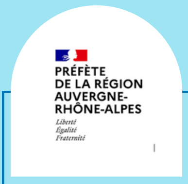
Direction Régionale des Affaires Culturelles Auvergne Rhône- Alpes