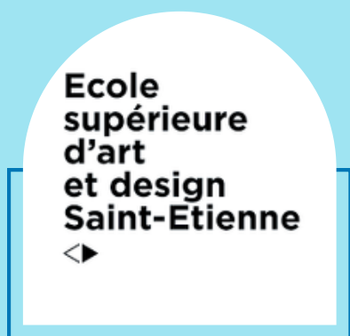
EPCC Cité du design - École supérieure d'art et design de Saint-Étienne

Un grand merci à nos partenaires et soutiens qui permettent le développement d'actions culturelles au CHU de Saint-Étienne. Grâce à eux, patients, soignants et proches vivent des moments de partage, de créativité et d'évasion au cœur de l'hôpital.